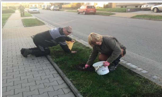
Výsadba cibulovin podél hlavní cesty

Na listopadovém zasedání zastupitelstvo schválilo rozpočet obce na příští rok. Od tohoto dokumentu se odvíjí předpokládané příjmy a výdaje obce. Rozpočet obce lze přirovnat k rodinnému rozpočtu. Kde také počítáme s předpokladem příjmů a podle toho plánujeme své výdaje. V případě obce tvoří největší část příjmů daňové příjmy, které dostáváme ze státního rozpočtu. Nedaňové příjmy souvisí s hospodářskou nebo podnikatelskou činností obce (pronájem majetku, tržby z prodeje aj.). Příjem z dotace ovlivňují vypsání dotační programy. Do výdajů jsme zařadili investice na projekt nazvaný „Regenerace veřejných prostranství v Podolí v okolí radnice a kulturního domu“. Jak již sám název říká bude se jednat o vybudování chodníků, parkovacích míst a výsadbu zeleně v prostoru před kulturním domem a obecním úřadem. Dále budeme pokračovat v jednáních a pracích na plánované nové kanalizaci. Další náš záměr potěší sportovce, protože máme v plánu vyměnit asfaltovou plochu na dětském hřišti na Záhumní za umělý povrch, vyměnit oplocení, doplnit zeleň. Hřiště by mělo sloužit pro košíkovou, volejbal, florbal aj. Výdaje počítají také s novou střechou na budově obecního úřadu.