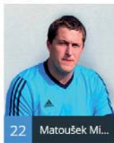
22 Matoušek Mi...