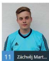
11 Záchvěj Mart...