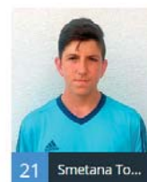
21 Smetana To...