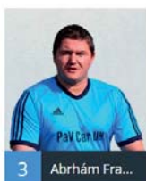
3 Abrahám Fra...