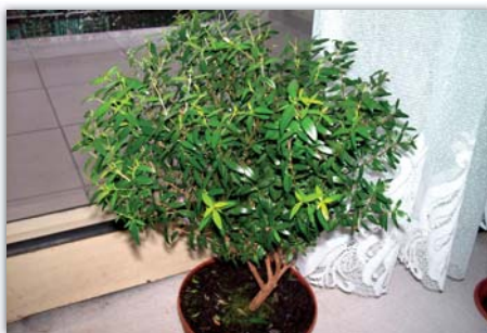
Keřík myrty, zdroj www.pokojovky.cz