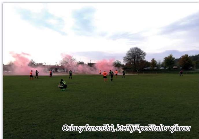
Osłavy fanoušků, kteří již počítali s výhrou