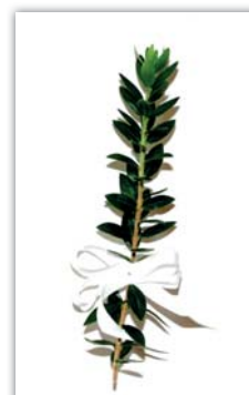
Vonička myrty, zdroj www.kvetiny-majak.cz