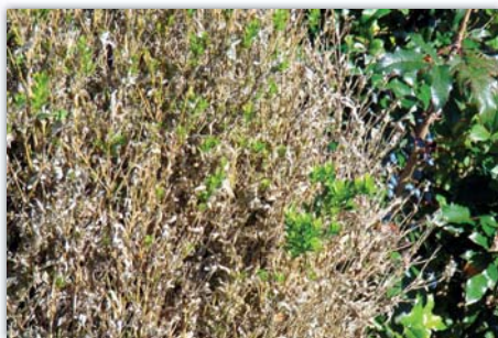
Detail krušpánku napadeného houbou