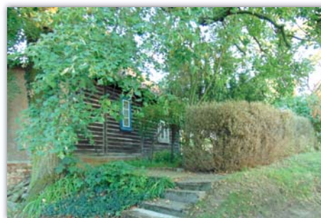
Odumírající živý plot z krušpánku