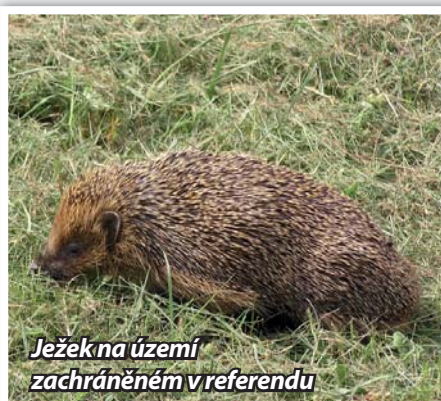
Ježek na území zachráněném v referendu