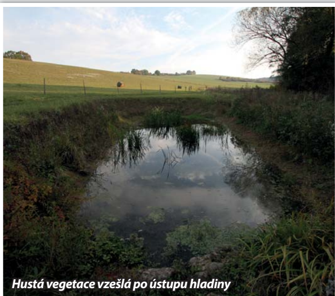
Hustá vegetace vzešla po ústupu hladiny