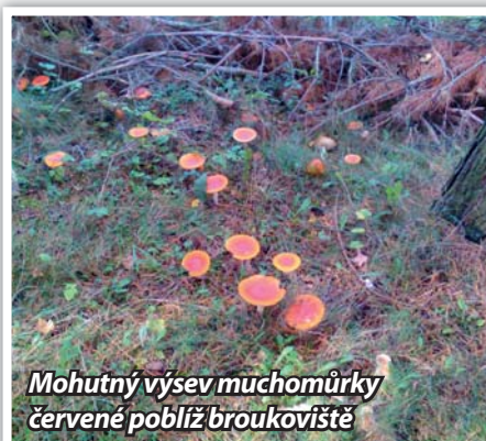
Mohutný výsev muchomůrky červené poblíž broukoviště