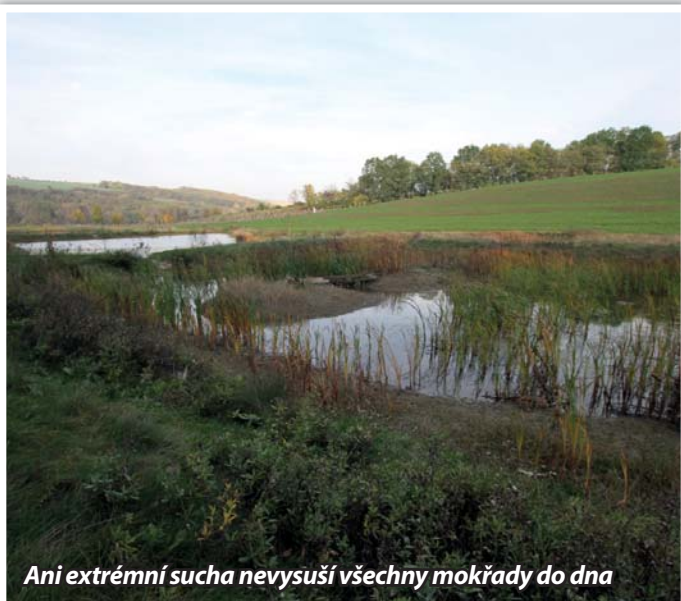
Ani extrémní sucha nevysuší všechny mokřady do dna