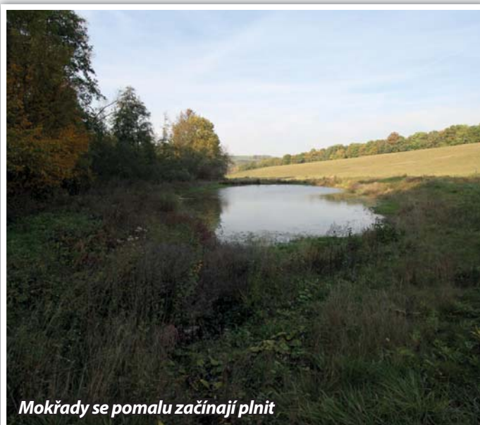
Mokřady se pomalu začínají plnit