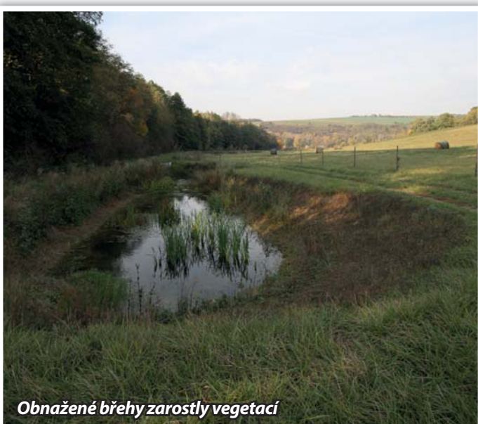
Obnažené břehy zarostly vegetací