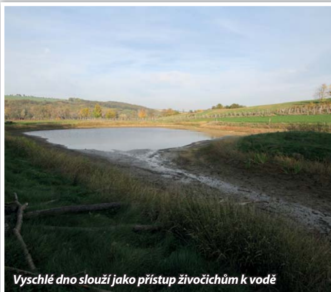
Vyschlé dno slouží jako přístup živočichům k vodě