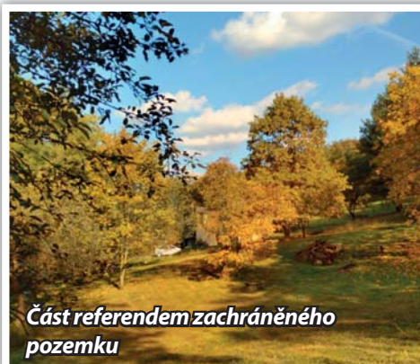
Část referendem zachráněného pozemku