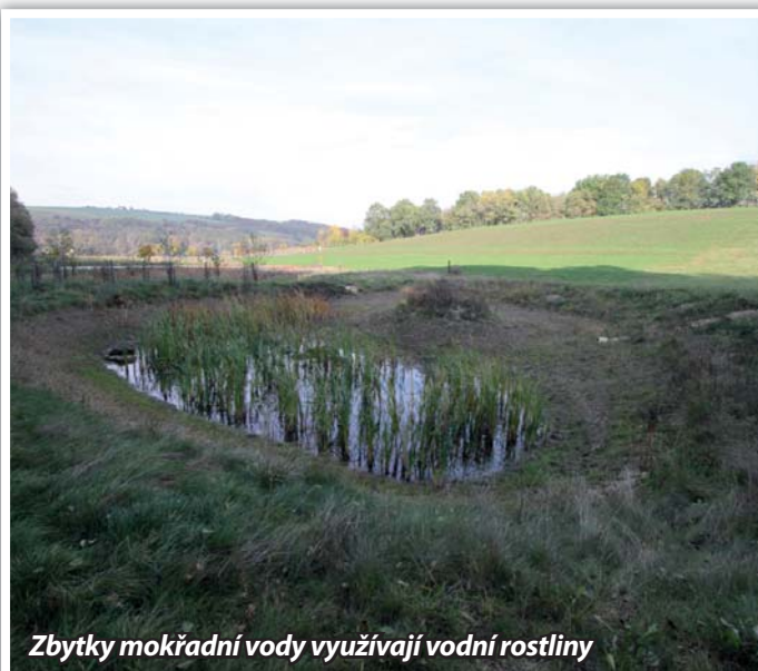
Zbytky mokřadní vody využívají vodní rostliny