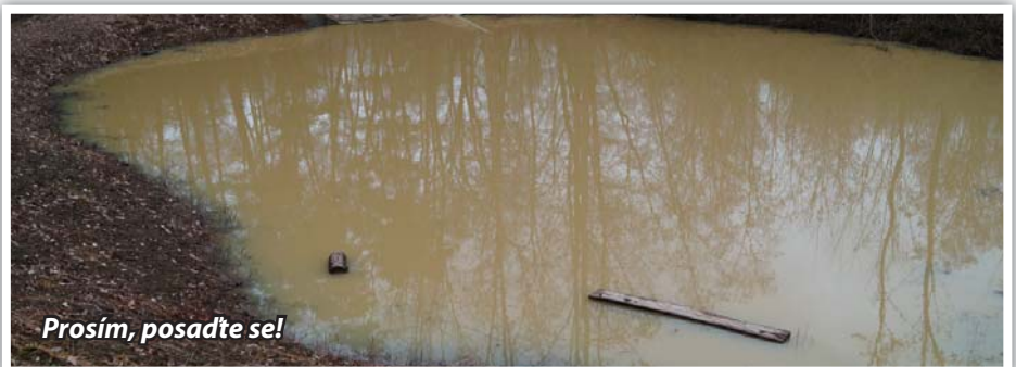
Prosím, posadte se!

dvou akátových laviček ve vodě mokřadu. Škoda, že ji raději nepoužil k tichému pozorování probouzejícího se ptactva. Destrukce je zbabělost!