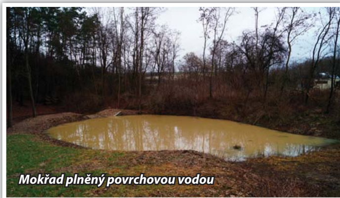
Mokřad plněný povrchovou vodou