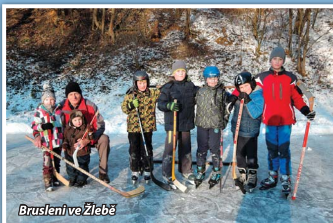
Bruslení ve Žlebě