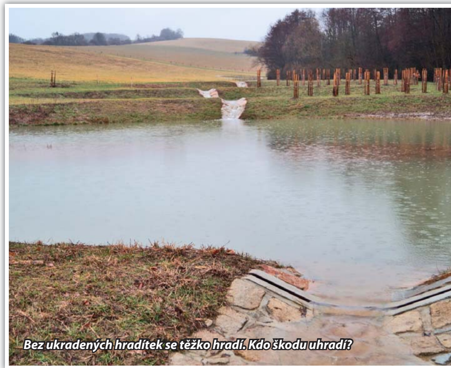
Bez ukradených hradítek se těžko hradí. Kdo škodu uhradí?

V parném létě se přidá i funkce ochlazovací , která však není vidět, ale spíše cítit. Značná masa vody zadržovaná v mokřadních nádržích a tůních jen pomalu a postupně zvyšuje svoji teplotu. Oproti rychle se ohřívajícímu zemskému povrchu si dlouho udržuje nižší teplotu a ochlazuje tak v horkých dnech okolní krajinu.