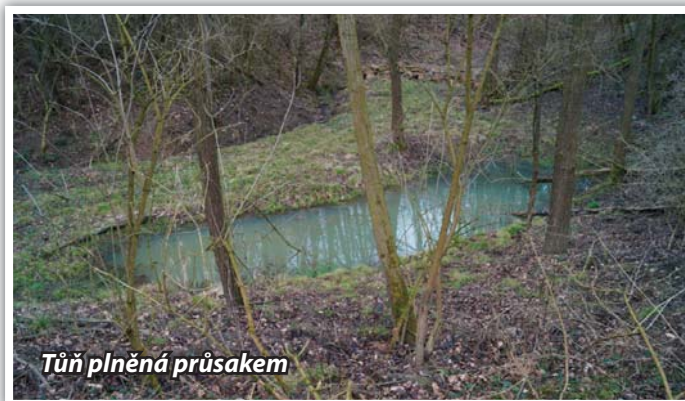
Tůň plněná průsakem