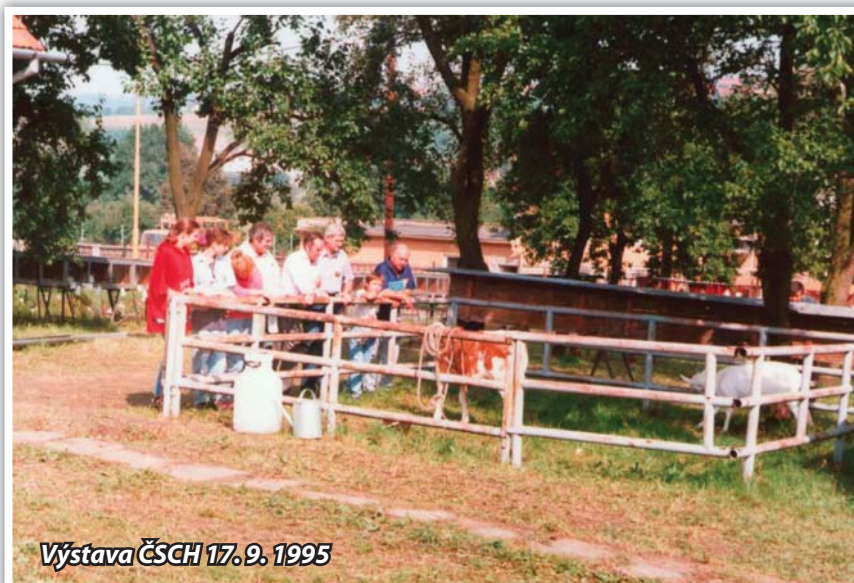
Výstava ČSCH 17. 9. 1995

Další informace se objevují ve Zpravodaji MNV Podolí za rok 1988.