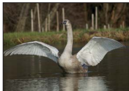
mládě labutě velké

jsme pro účastníky uspořádali krátkou přednášku. Zájem o tuto problematiku byl skutečně značný a pro nás potěšující.