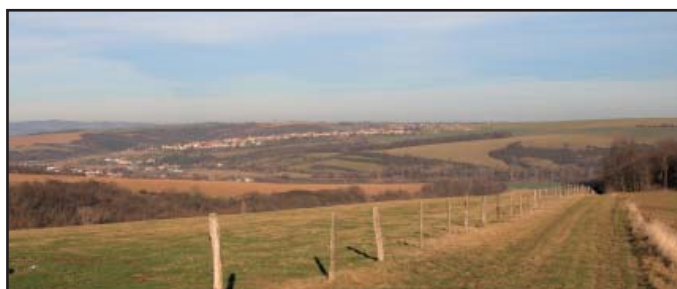
stav opravené a zatravněné cesty v prosinci 2014