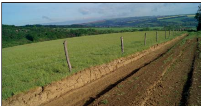
vyjeté koleje a zničená tráva v květnu 2015